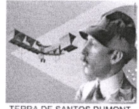
TERRA DE SANTOS DUMONT