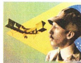
TERRA DE SANTOS DUMONT