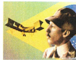
TERRA DE SANTOS DUMONT

As Fatecs atendem mais de 96 mil alunos matriculados em 85 cursos de graduação tecnológica, em diversas áreas, como Construção Civil, Mecânica, Informática, Tecnologia da Informação, Turismo, entre outras.